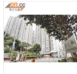
華明邨擬增加管理費兩成，有業主認為加幅太高。(資料圖片)