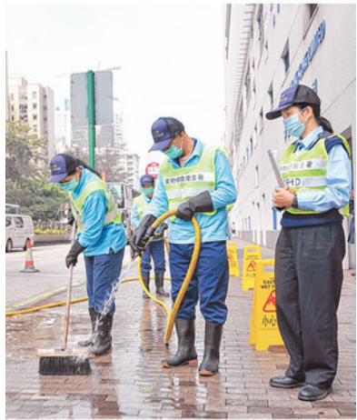
最低工資下月調升，不少政府清潔承辦商均受到影響。(資料圖片)